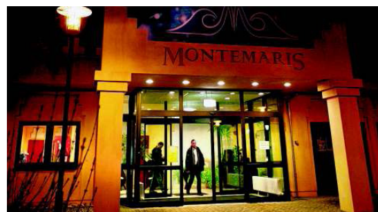
Gehen im Montemaris bald auf unabsehbare Zeit die Lichter aus?

Wäschenbeuren rüstet sich für den An- sturm von Cowboys und Indianern. Am Freitag bis zum Sonntag soll beim Sport- platz der Wilde Westen aufleben. Die Schüt- zenliste, die mit der Gruppe Tombstone Marshals ob ihrer authentischen Verklei- dung preisgekrönt Westernhelden in ih- ren Reihen weiß, richtet die Wildwesttage aus. Geboten werden am Katzenbach, der zum Cat Creek mündet, neben Musik mit der Silver Eagle Band am Freitagabend und R.E.A.C.H. am Samstagabend auch Gold- waschen, Revolvershows und natürlich ein echtes Cowboycamp. non